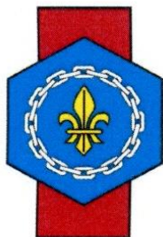
Fédération Française de Généalogie

Archives nationales – 60 rue des Francs-Bourgeois – 75003 Paris Métro : Rambuteau ou Hôtel de Ville