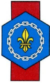
Fédération française de Généalogie - FFG