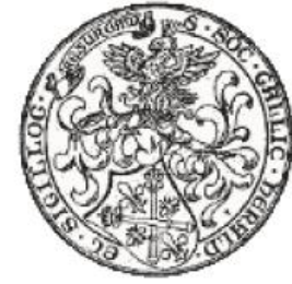
Société française d'Héraldique et de Sigillographie - SFHS

33 e Congrès international des Sciences généalogique et héraldique – Arras – 2-5 octobre 2018 33 rd International Congress of Genealogical and Heraldic Sciences