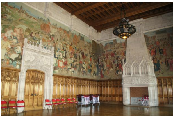
◁ L'hôtel de ville d'Arras - City Hall