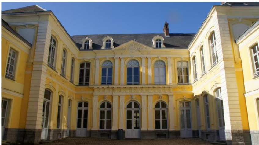
◁ l'Hôtel de Guînes

▶ après 18h00 (sur inscription/optional) : visite privée de l'exposition Arras-Versailles "Napoléon", au Musée des Beaux-Arts, palais Saint-Vaast / Private visit of Arras-Versailles Exhibition "Napoléon", Fine Arts Museum, palais Saint-Vaast.